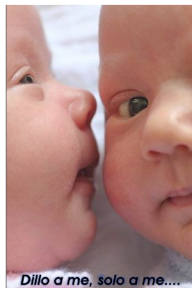
Dillo a me, solo a me....

Brevemente le regole riguardano il non interrompere, non giudicare o interpretare ciò che un'altra persona sta dicendo, la libertà di partecipare o non partecipare alle attività proposte e il diritto alla riservatezza.